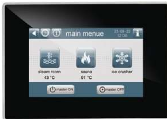
Ekran dotykowy, 4,3", 64000 kolorów

Systemy do centralnego sterowania wszystkimi strefami (sauny, łaźnie parowe itp.), ich komponentami (podgrzewacze sauny, generatory pary, dozowanie zapachów, oświetlenie itp.) i parametrami (temperatura, wilgotność itp.) strefy Wellness z jednego centralnego wyświetlacza. Centralne systemy sterowania są planowane i produkowane w oparciu o projekty. Dlatego systemy mogą być indywidualnie dostosowywane do wymagań projektu. Do obsługi i wizualizacji używamy czytelnie zaprojektowanych i intuicyjnie rozmieszczonych ekranów dotykowych o przekątnej od 4,3" do 10". Mogą być programowane w kilku językach. Ponadto zmierzone wartości, aktualny stan operacyjny i alarmy mogą być wyświetlane na każdym urządzeniu obsługiwany przez przeglądarkę, takim jak komputer, smartfon lub tablet.